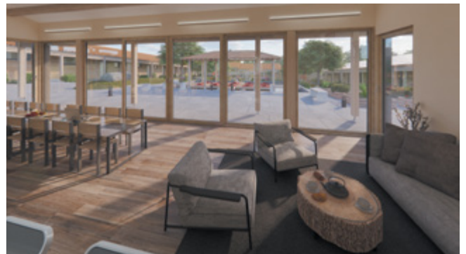
Vue depuis la salle commune

La mise en œuvre au quotidien : en se dédiant à l'activité du centre – rendant ainsi le Dharma accessible au plus grand nombre –, ce qui permet d'éprouver sa compréhension de l'étude et de la pratique méditative.