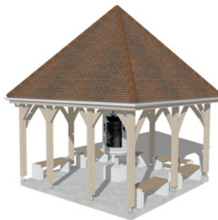
■ Le moulin à prières

Le coût du projet est en cours d'estimation (il inclura les huit stoupas, le moulin à prières, le grand chemin de circumambulation et les aménagements paysagers).