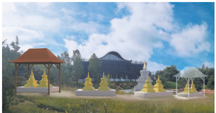
■ Aperçu du projet des huit stoupas

Nous vous remercions pour votre générosité et nous nous réjouissons de vous accueillir bientôt à Dhagpo Kagyu Ling.